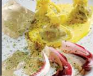
Fagottino di pasta fresca al tastasale e radicchi con salsa leggera all'oro rosso (zafferano)