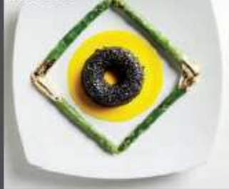
Savarin di riso venere con salsa allo zafferano e asparagi con foglia d'oro