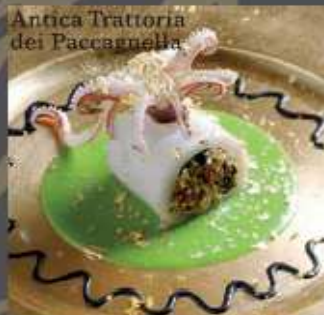
Anello di calamario farcito con granella di frutta secca su purea di piselli guarnito all'oro