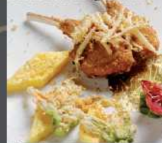
Costolette su oro giallo farcite ai formaggi con punte bianche e verdi