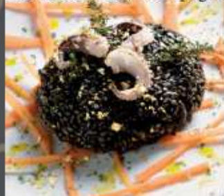
Risotto al nero di seppia con foglia d'oro