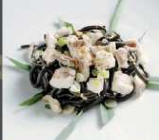
Tagliolini neri con polpa di branzino e pepite d'oro