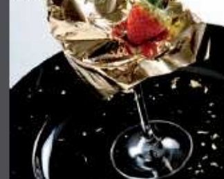
Nuvola d'oro su fragole e cioccolato