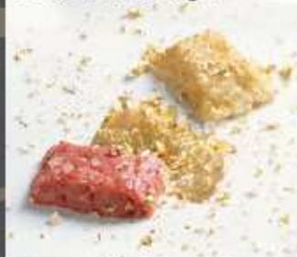
Lingotto di fassona piemontese con sale dell'Himalaya e cognac XO