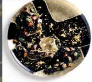
Riso venere nero, oro grezzo, pollo di Corte Benedettina e tenere sculture di verdure con polvere dorata al curry