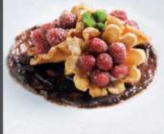
Fiore del bosco