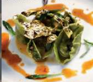
Ravioli alle erbe e faraona di corte padovana con foglia d'oro