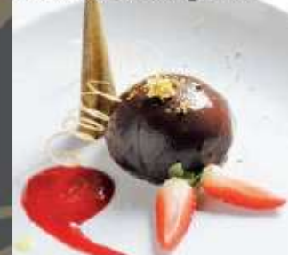
Il cioccolato, l'oro e il caramello in semifreddo