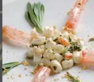
Gnocchetti di ricotta con erbe, gamberoni, fumo e oro