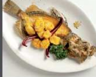
Cabochon di sampietro in pastella con doratura